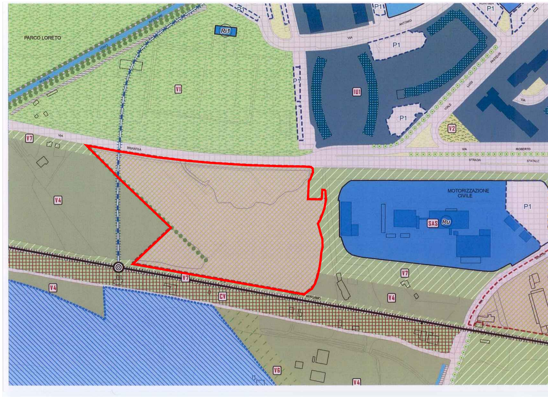
ESTRATTO PGT - PIANO DELLE REGOLE