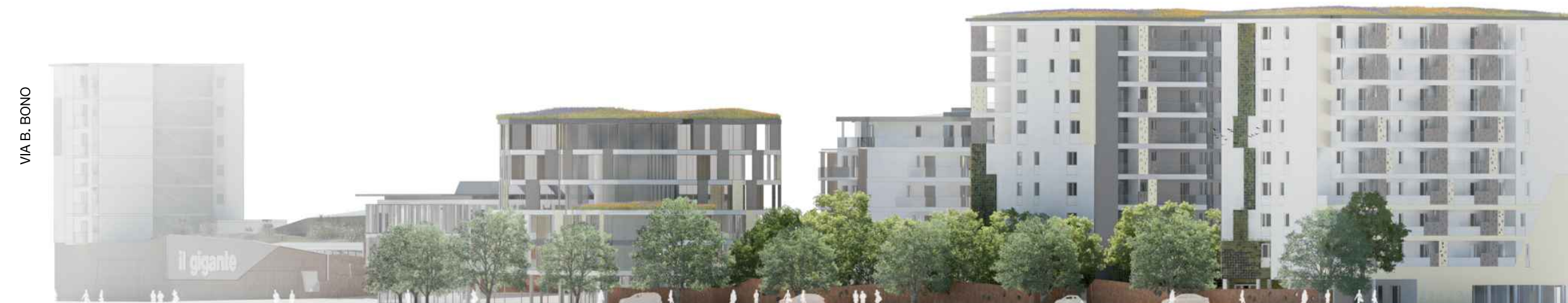
PROSPETTO EST LOTTO 2