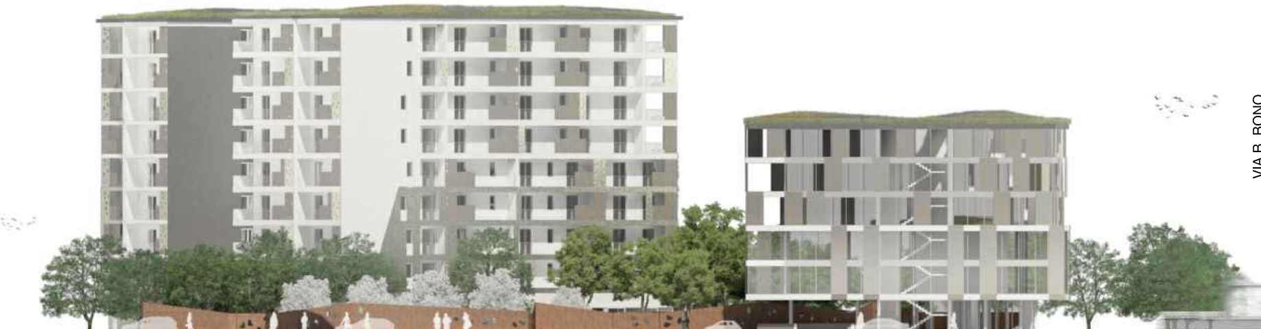
PROSPETTO OVEST LOTTO 2