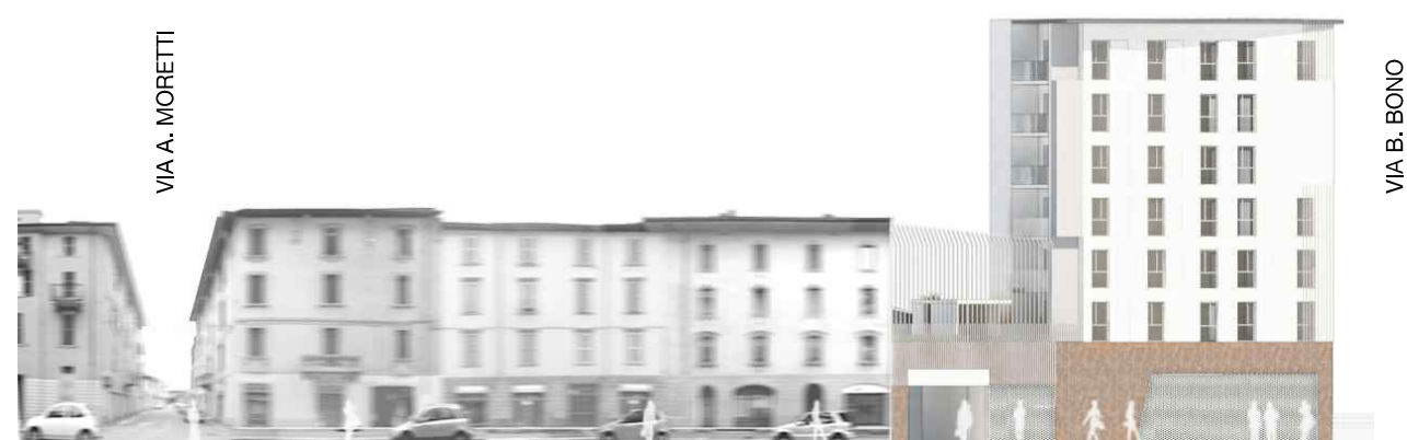
PROSPETTO OVEST LOTTO 1