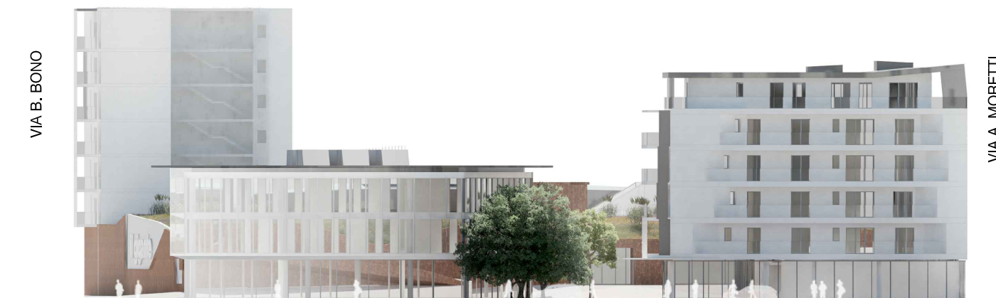
PROSPETTO EST LOTTO 1