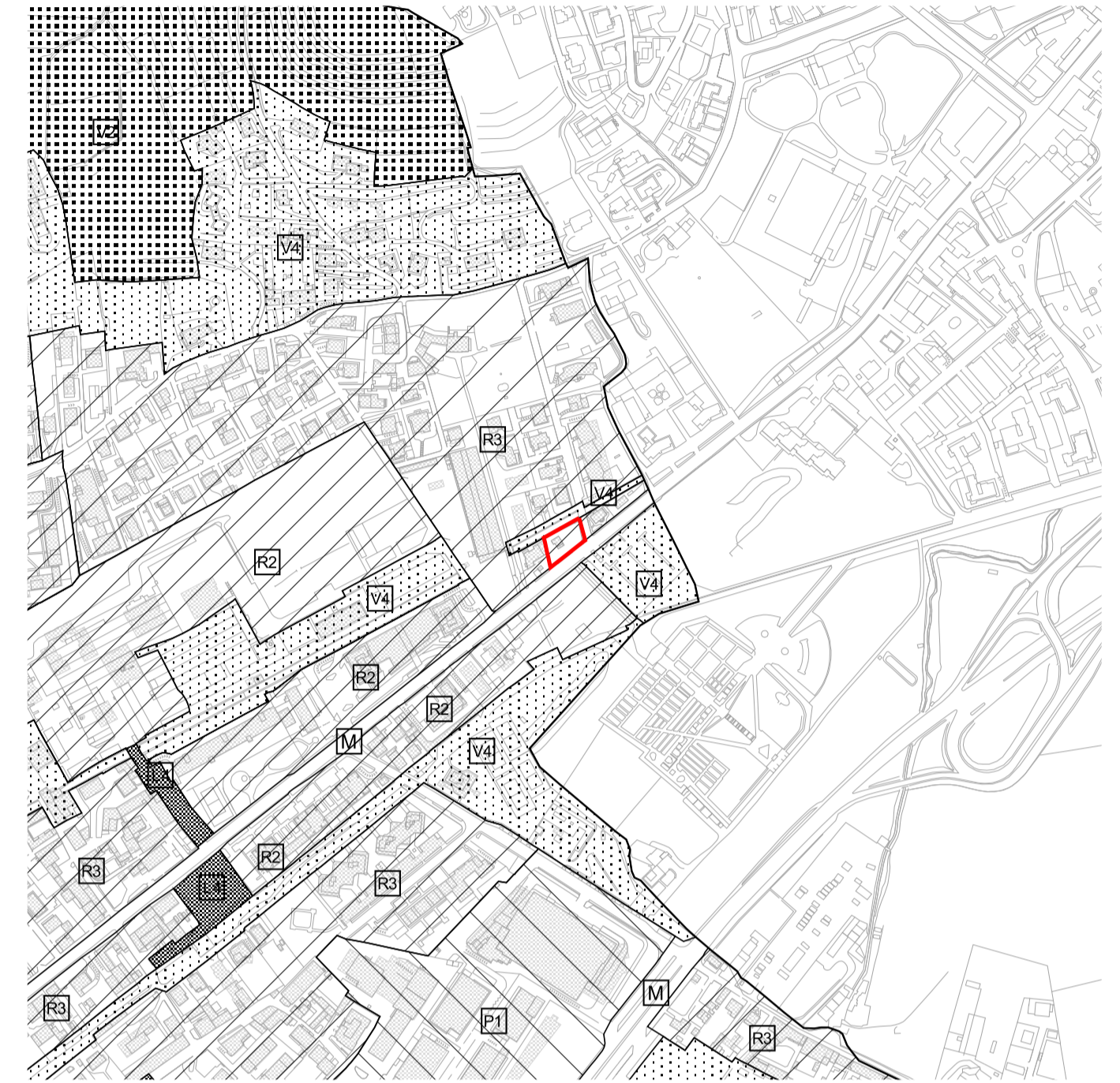
PROGETTO: LA STRUTTURA DI PIANO - I SISTEMI - SCALA 1:5.000