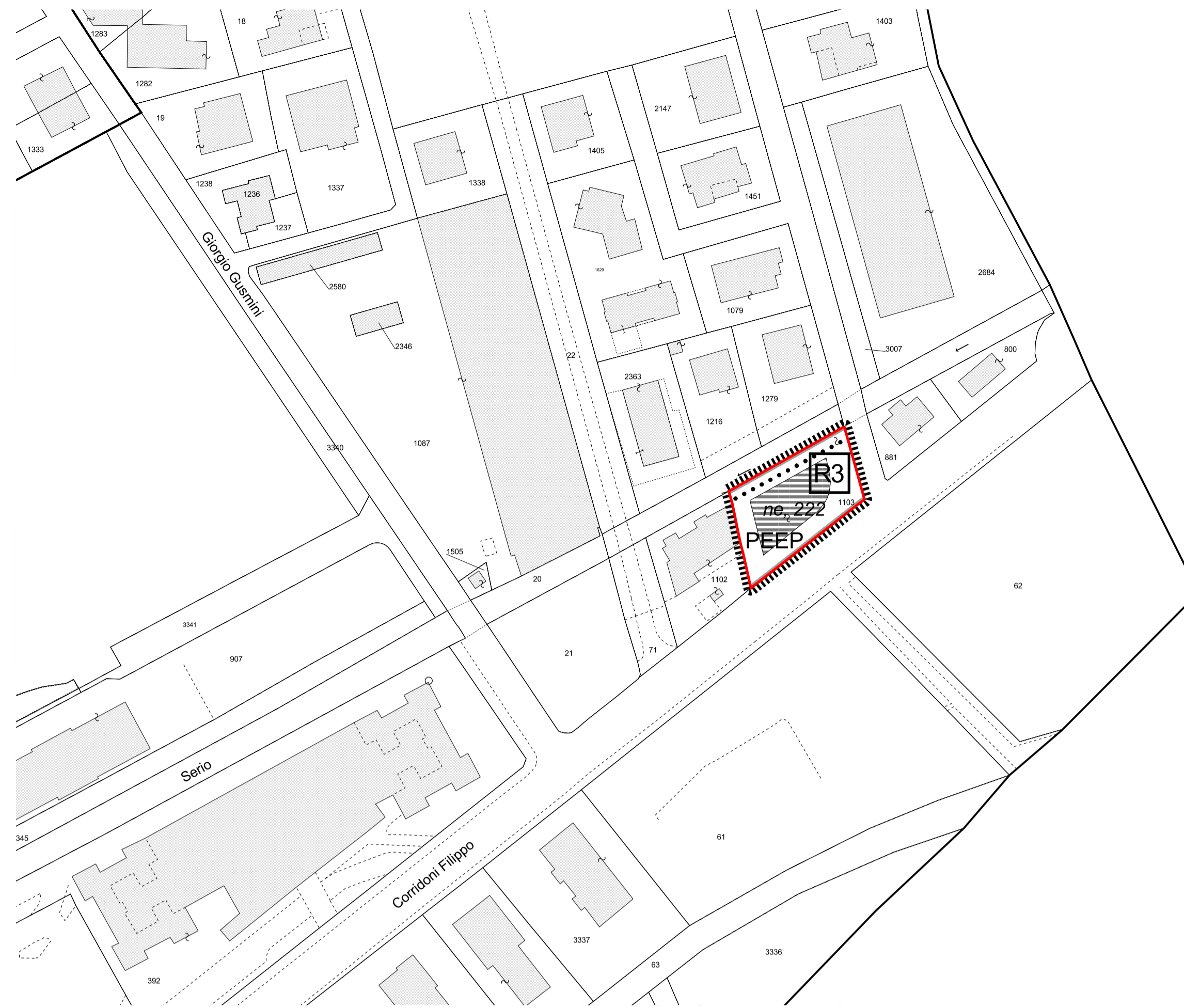
PROGETTO: USI DEL SUOLO E MODALITA' DI INTERVENTO - SCALA 1:1.000