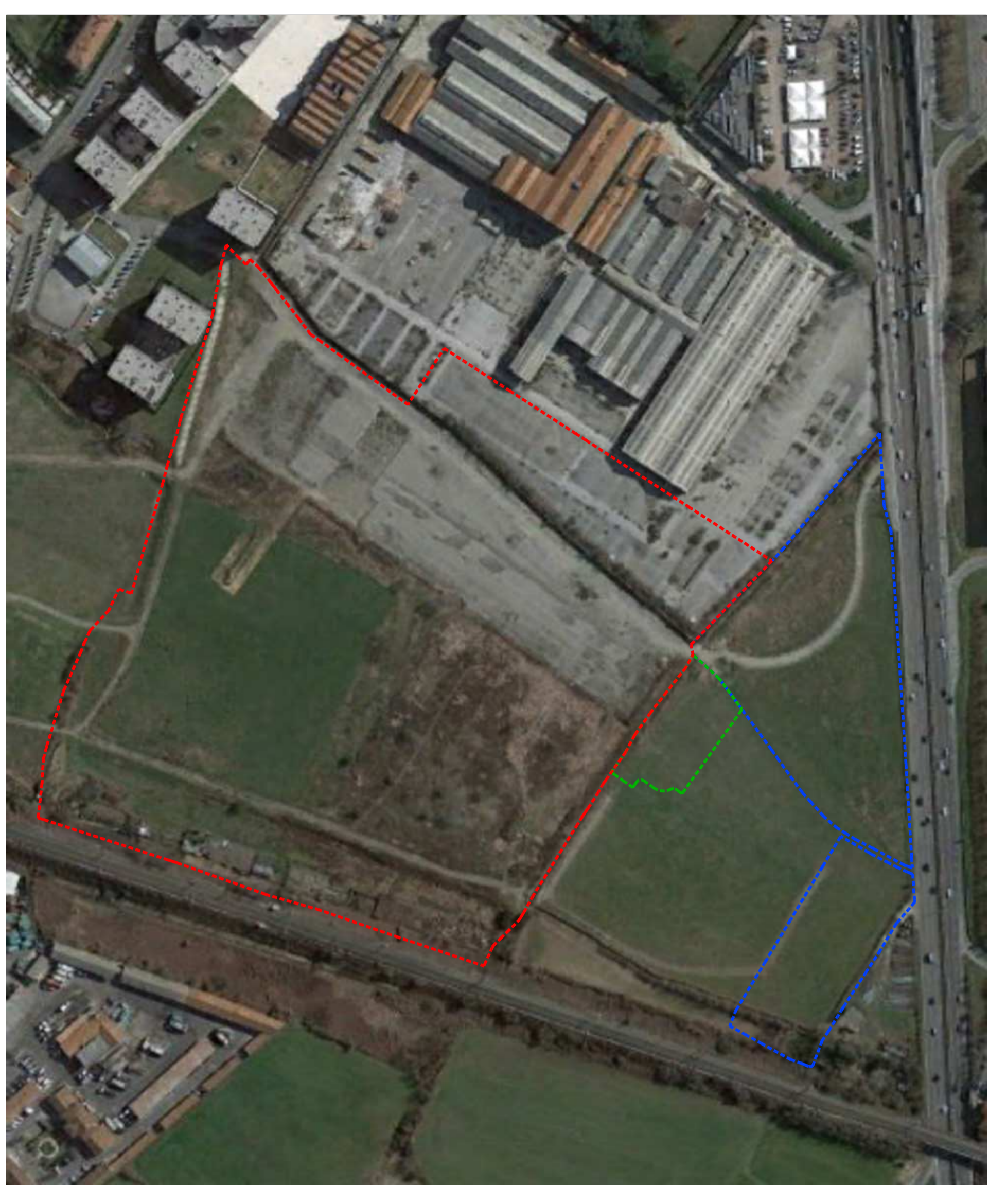
ESTRATTO ORTOFOTO scala 1:2000