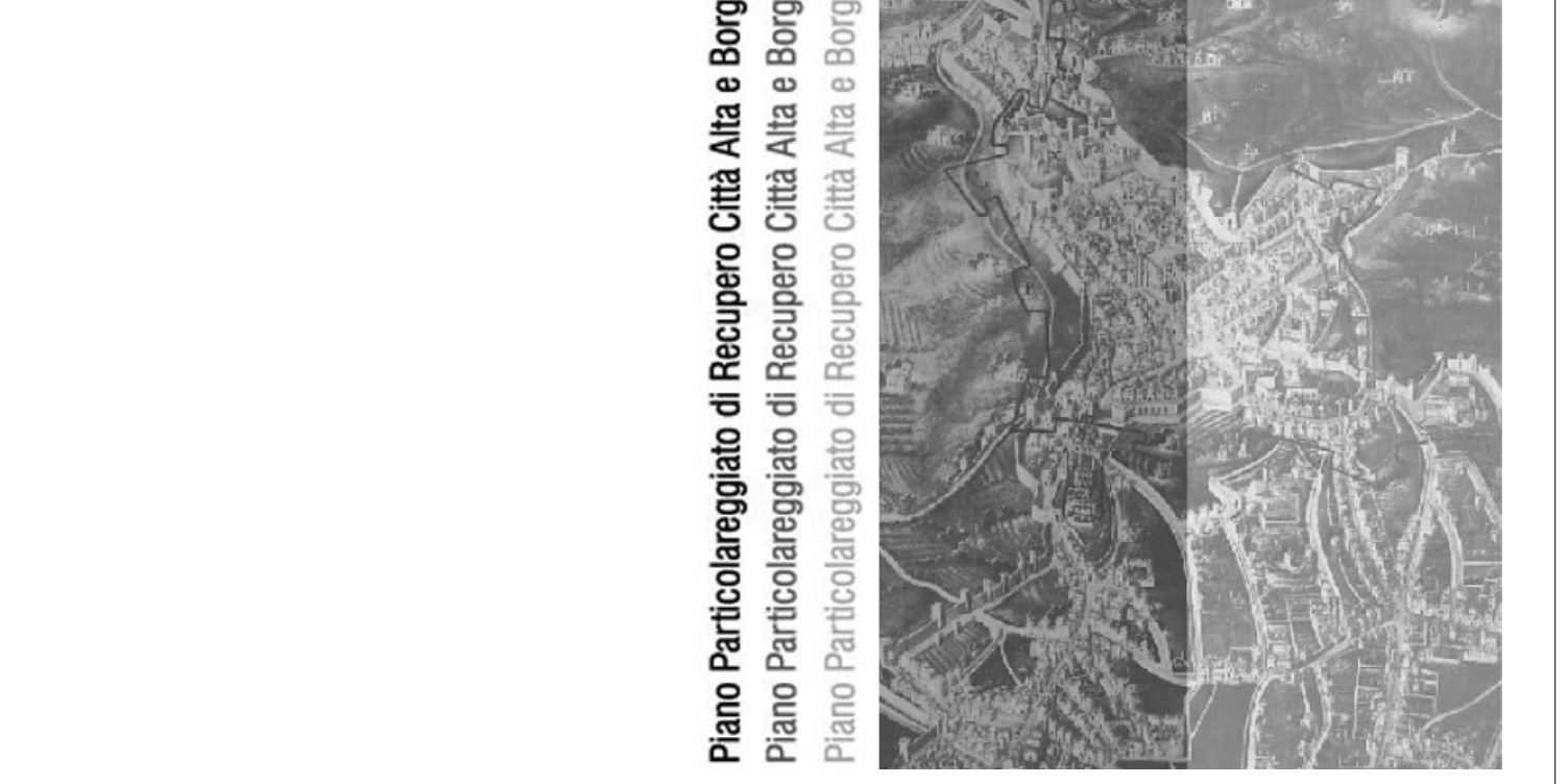
Piano Particolareggiato di Recupero Città Alta e Borgo Canale Piano Particolareggiato di Recupero Città Alta e Borgo Canale Piano Particolareggiato di Recupero Città Alta e Borgo Canale

Tavola di disciplina D7.1 Dispositivo regolamentare di attuazione