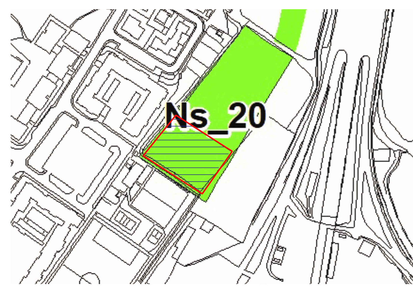
ESTRATTO PGT - Tav DP08 - La perequazione: aree di decollo e atterraggio

LEGENDA Area di proprietà Loreto Immobiliare esterna al P.A. da cedere al Comune di Bergamo superficie complessiva mq. 3.000 Foglio 103 - Mappale 2511