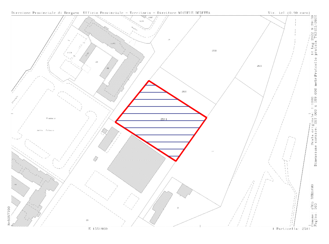
ESTRATTO MAPPA AREA ESTERNA AL P.A. DA CEDERE AL COMUNE