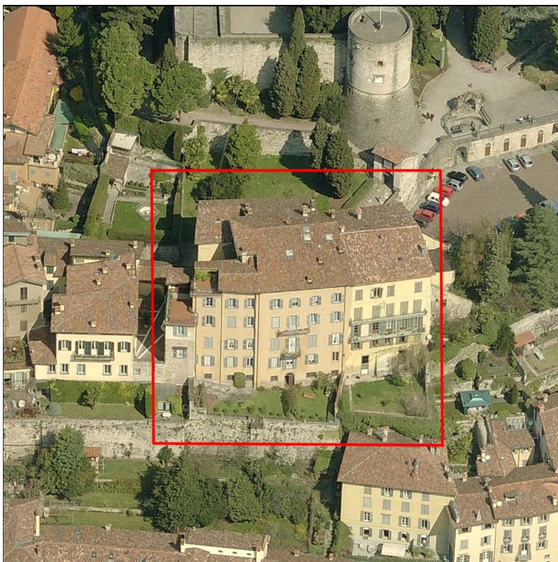
Estratto foto prospettica