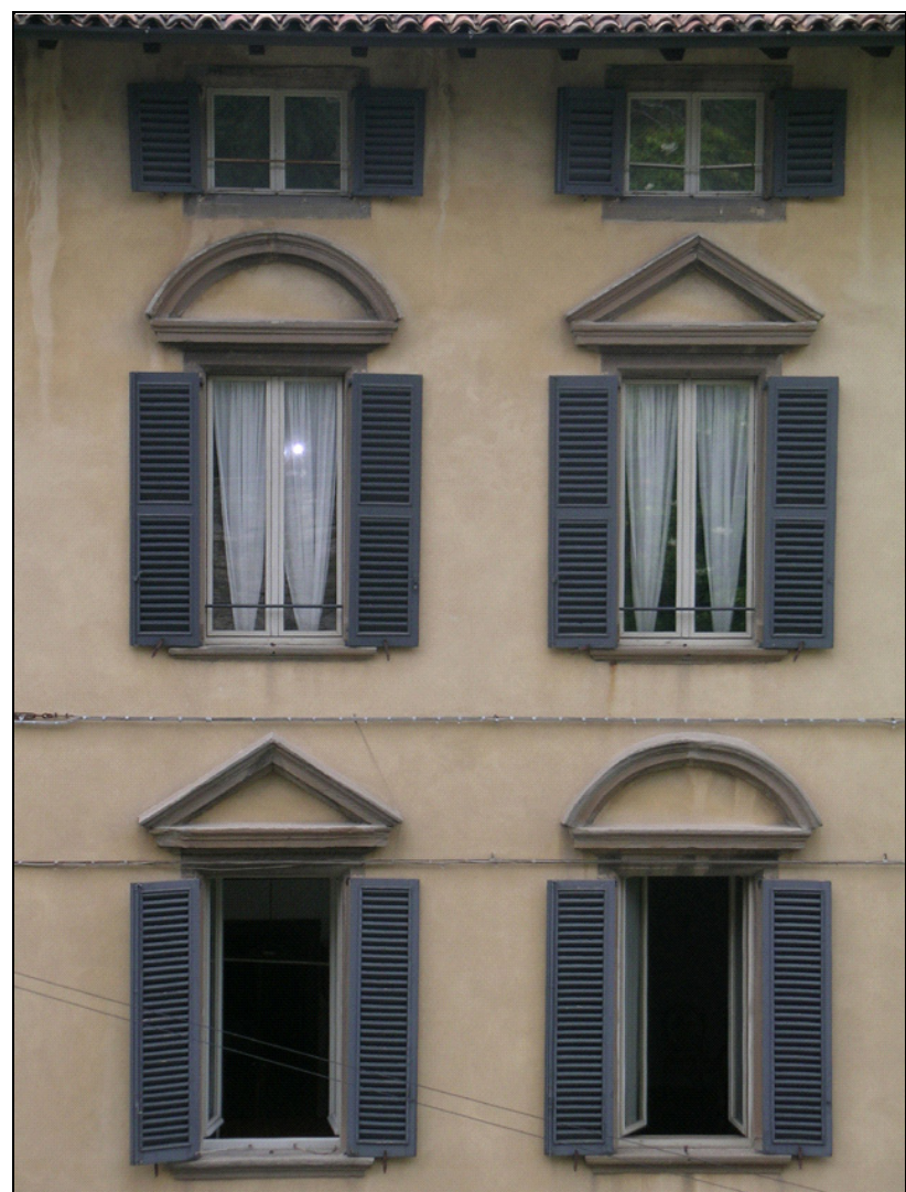
Rilievi effettuati a cura di: Comune di Bergamo (Giugno 2009)