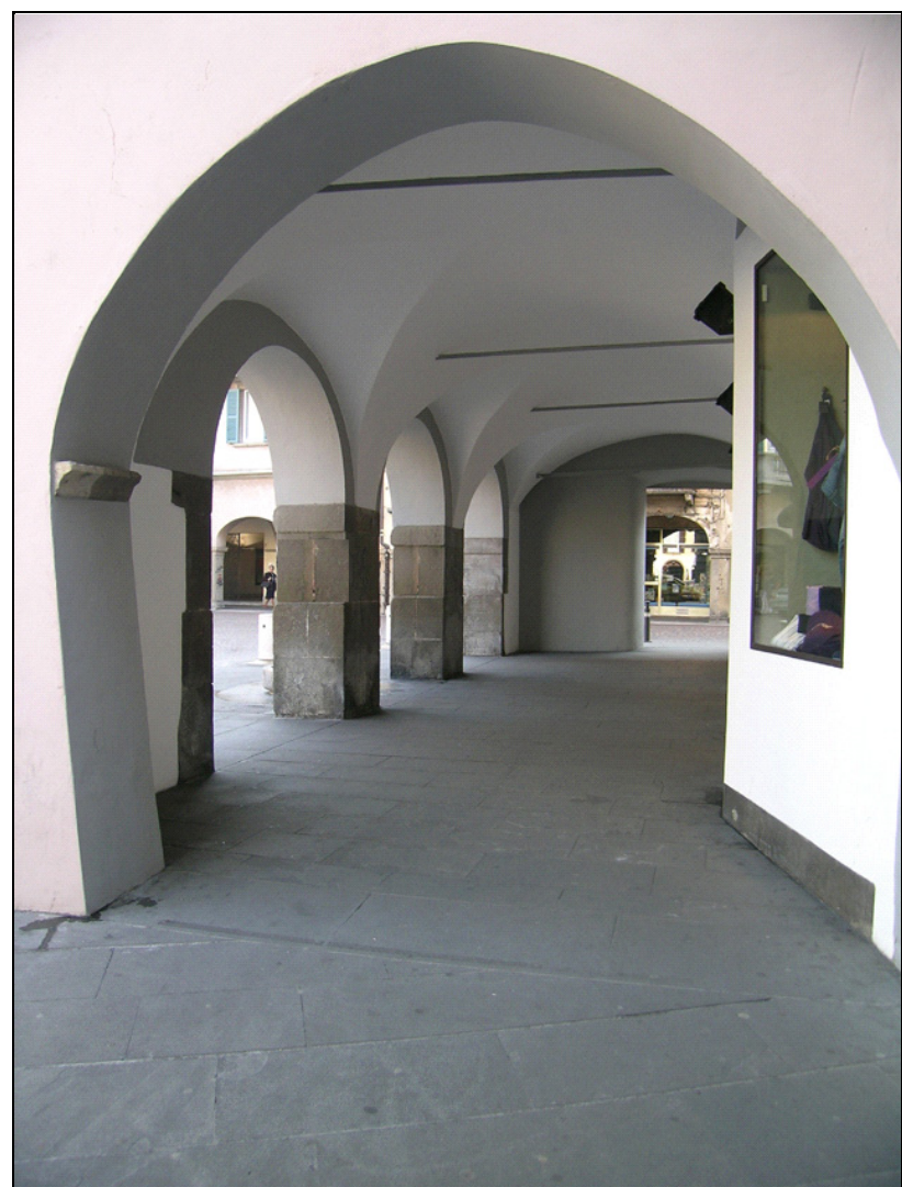
Rilievi effettuati a cura di: Comune di Bergamo (Aprile 2009)