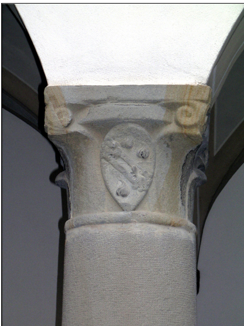
Rilievi effettuati a cura di: Comune di Bergamo (Aprile 2009)