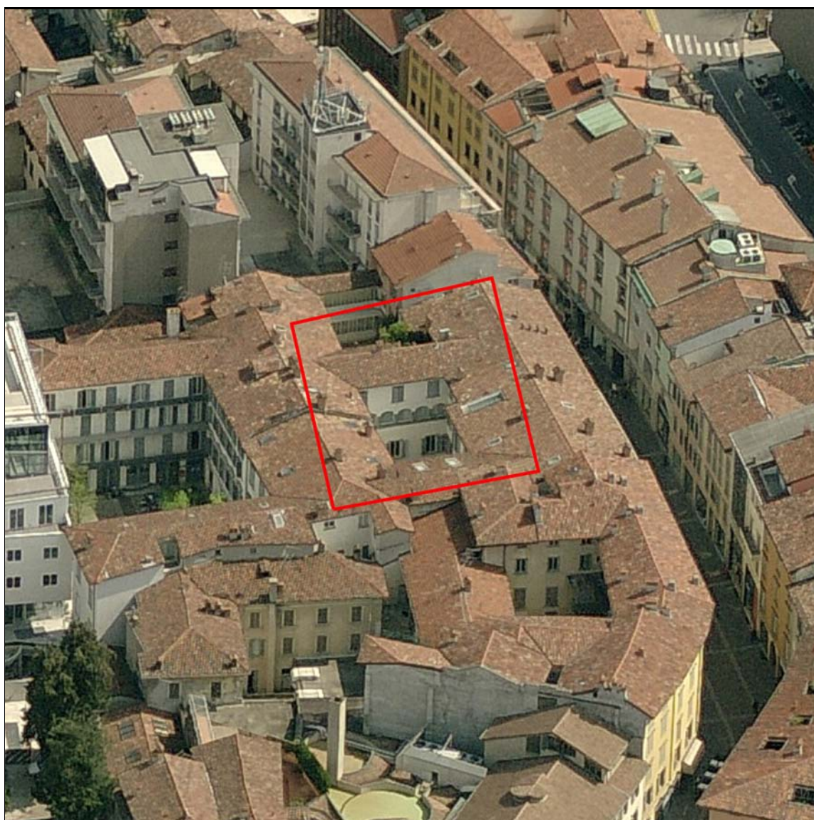
Estratto foto prospettica