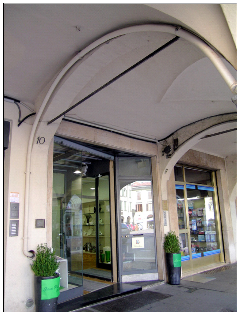
Rilievi effettuati a cura di: Comune di Bergamo (Aprile 2009)