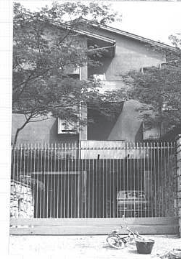
ELEMENTI DI IDENTIFICAZIONE GRAFICA E FOTOGRAFICA