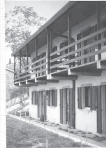
ELEMENTI DI IDENTIFICAZIONE GRAFICA E STRUTTURALE