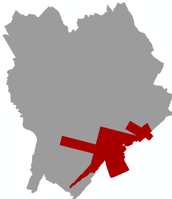
Figura 2 - Ambito oggetto della variante urbanistica agli atti di PGT