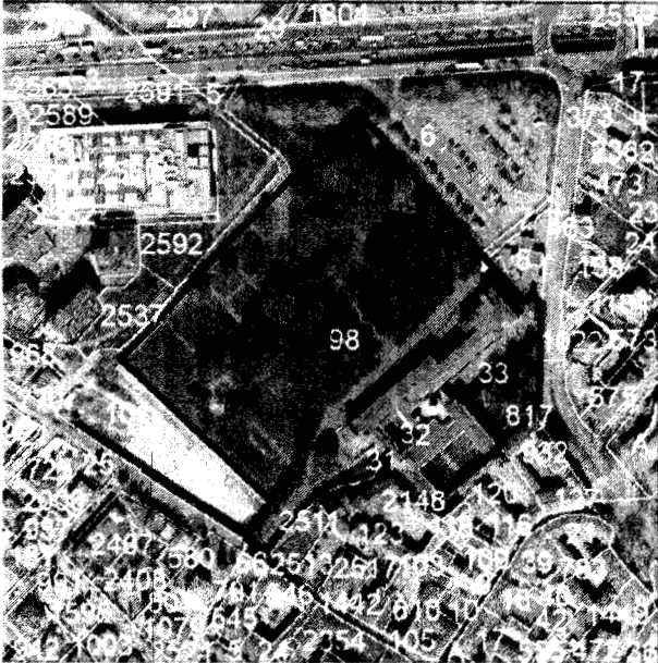
Ortofoto 2023 e Particelle catastali

RICHIEDA DI INTEGRAZIONE DELLA DESTINAZIONE URBANISTICA "RG – SERVIZIO RELIGIOSO", "SO2 – SERVIZI SOCIALI (SERVIZI PER LE FRAGILITÀ)" ANCHE CON SH – SERVIZIO SANITARIO (SH2 CLINICHE/CASE DI CURA)" DEL SERVIZIO ESISTENTE SITO IN VIA SAN BERNARDINO N.161 IN COMUNE DI BERGAMO DI PROPRIETÀ DELL'ISTITUTO SUORE SACRAMENTINE